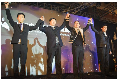
2013 中国婚庆行业发展峰会组委会向嘉宾致意